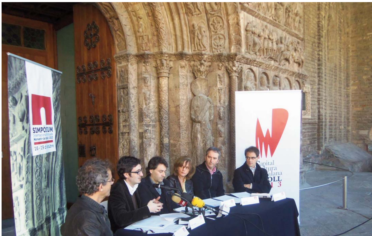
Presentació del simpòsium internacional sobre la portalada de Ripoll

Més enllà del programa oficial, el Centre d'Estudis Comarcals del Ripollès vol implicar la ciutadania i, per això, ha organitzat una sèrie d'activitats complementàries que començaran el proper mes d'abril i s'allargaran fins el mes de novembre. Es tracta de conferències sobre l'organització territorial, la pagesia, el monestir de Sant Joan, la Vall de Ribes, el monestir de Camprodon, la presència jueva a la comarca i les bíblies de Ripoll, entre d'altres.