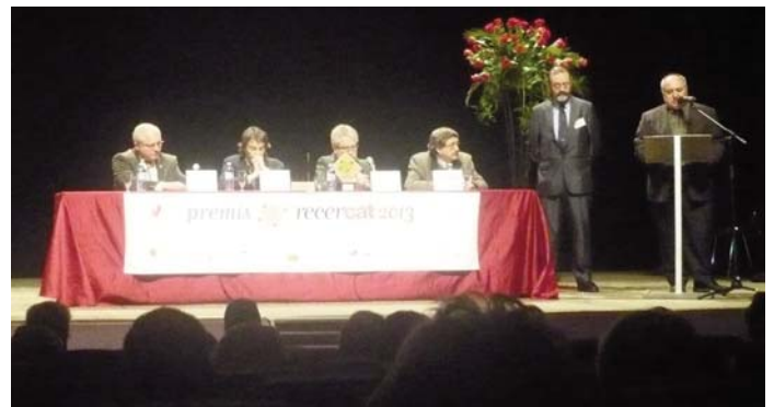
Premi Recercat 2013 al Centre d'Estudis Comarcals de Banyoles