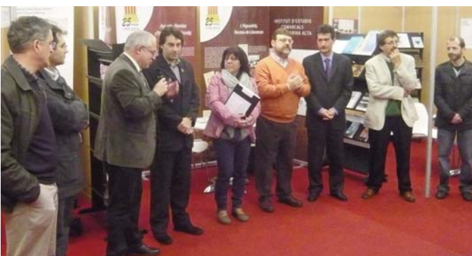
Acte d'inauguració del Recercat 2013