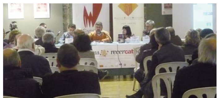
Sessió de treball del Recercat 2013