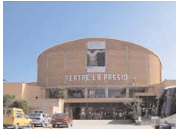
Una de les imatges característiques d'Esparreguera és el Teatre de la Passió. Més de cinc-centes persones de la Vila hi participen desinteressadament.