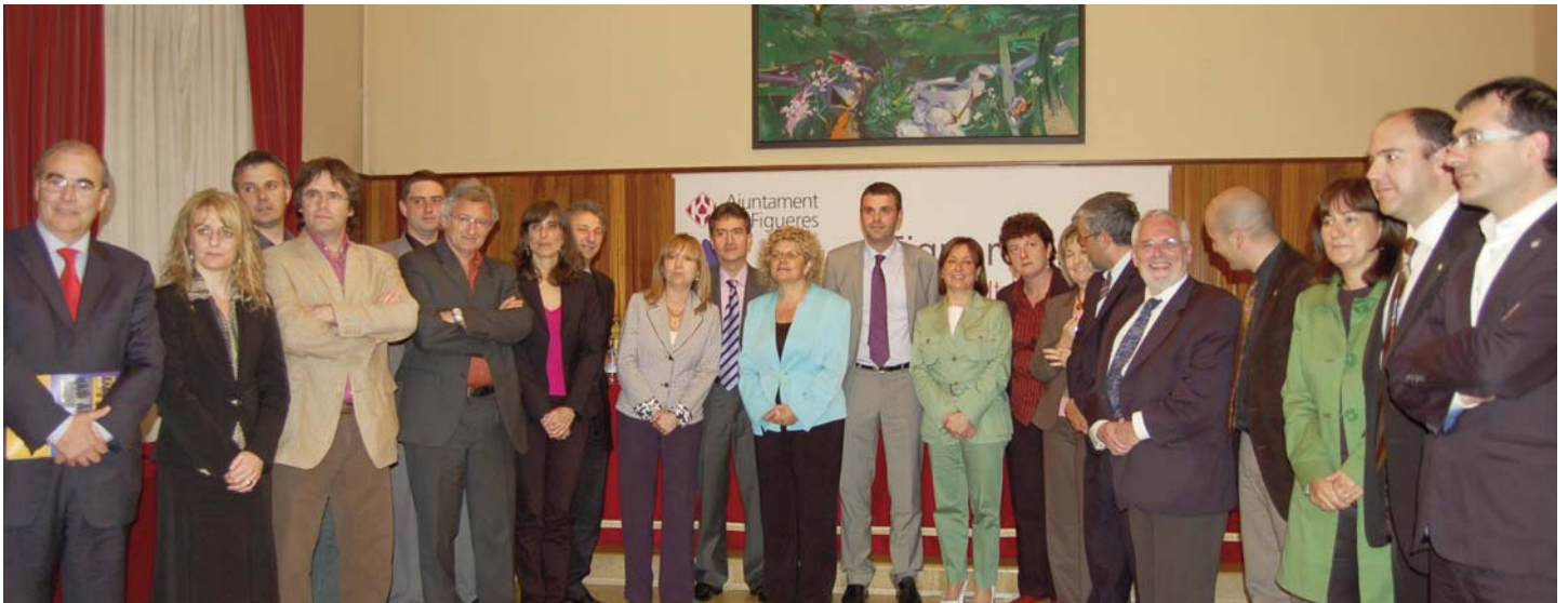
Autoritats que assistiren a l'acte de signatura de Figueres com a Capital de la Cultura Catalana 2009, al Saló de Plens de l'Ajuntament de la ciutat.

De la seva banda, la consellera de Salut va expressar el suport del govern català a aquesta iniciativa que s'adreça a tot el domini lingüístic i cultural català i té com a objectius els de contribuir a ampliar la difusió, l'ús i el prestigi social de la llengua i cultura catalanes, incrementar la cohesió cultural dels territoris de llengua i cultura catalanes i, finalment, promocionar i projectar el municipi designat com a Capital de