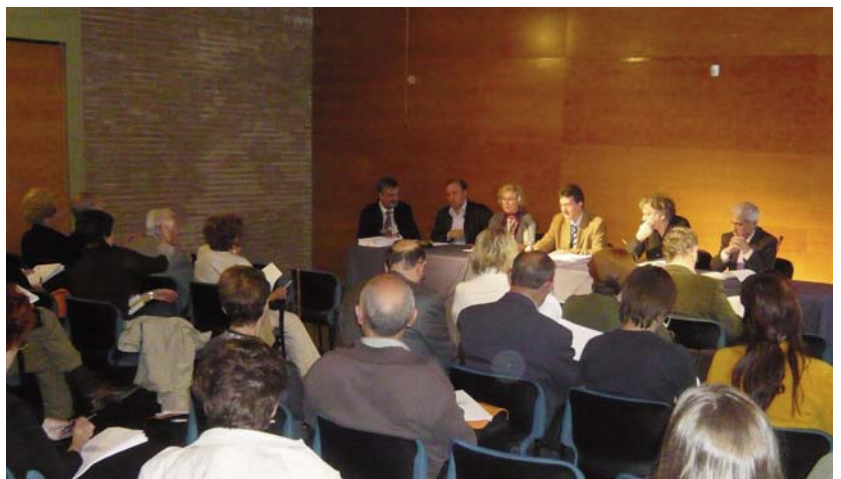
Assemblea general de la FIEC celebrada al Palau de Congressos de Tarragona.

Alhora, les entitats membres de la FIEC s'han ofert per a col·laborar amb la projecció internacional d'aquestes candidatures, que representen en l'àmbit cultural i esportiu a tot el país.