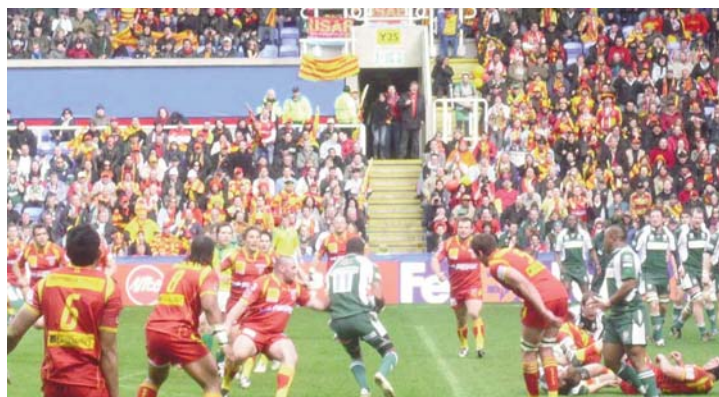
El partit de la USAP va ser una festa de catalanitat.

La USAP va incorporar a la samarreta l'emblema de la Capital de la Cultura Catalana Perpinyà 2008 i va estar acompanyat per força seguidors vinguts des de Catalunya Nord, els quals van portar al Madejski Stadium 300 banderes catalanes i van entonar càntics durant tot el partit manifestant la catalanitat de la USAP.