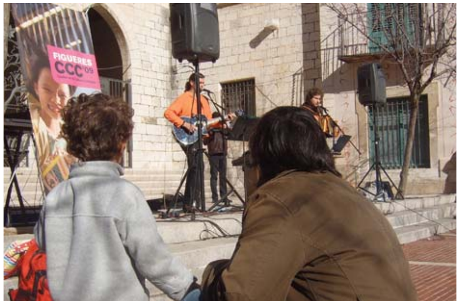
Quartet de Tramuntana, a la plaça Sant Pere de Figueres.

Els aperitius culturals se celebren durant tota la capitalitat cultural, amb una variada oferta artística adreçada a tota mena de públics.