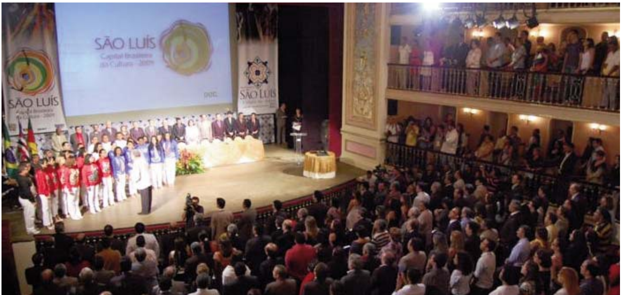
Acte d'inauguració de la Capital Brasileira de la Cultura São Luís 2009.

São Luís, ciutat fundada pels francesos el 1612, està ubicada al nord-est del Brasil i és la capital de l'Estat de Maranhão. Té una població d'un milió d'habitants. El seu centre històric fou declarat Patrimoni de la Humanitat per la Unesco, el 1997.