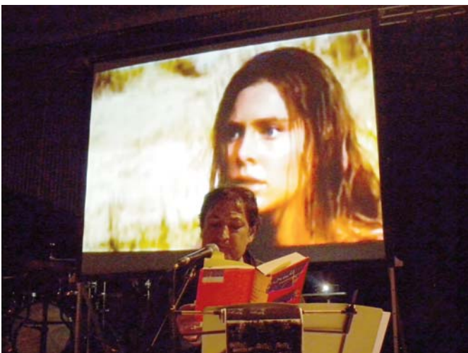
Recital videopoètic al Museu de l'Empordà.