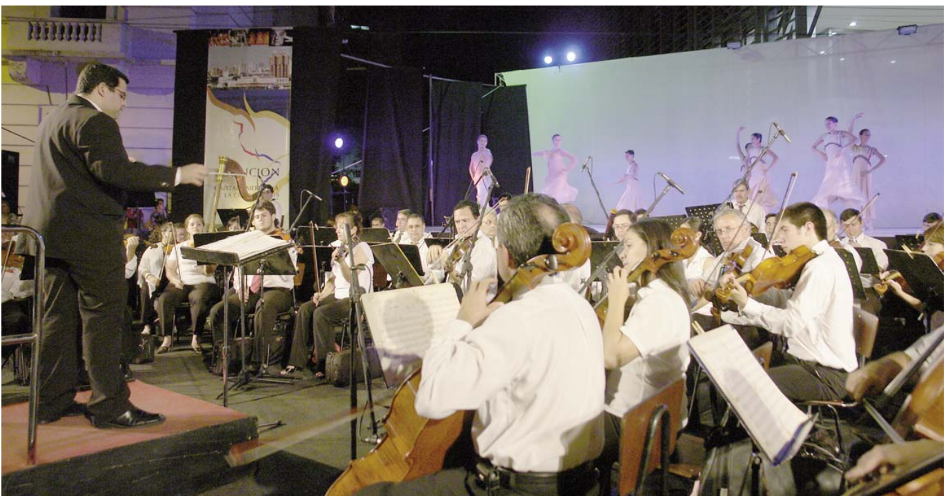
Acte d'inauguració de la Capital Americana de la Cultura Asunción 2009.

D'altres activitats destacades seran: la Trobada del Pobles originaris d'Amèrica i la Setmana de les Governacions d'Asunción.