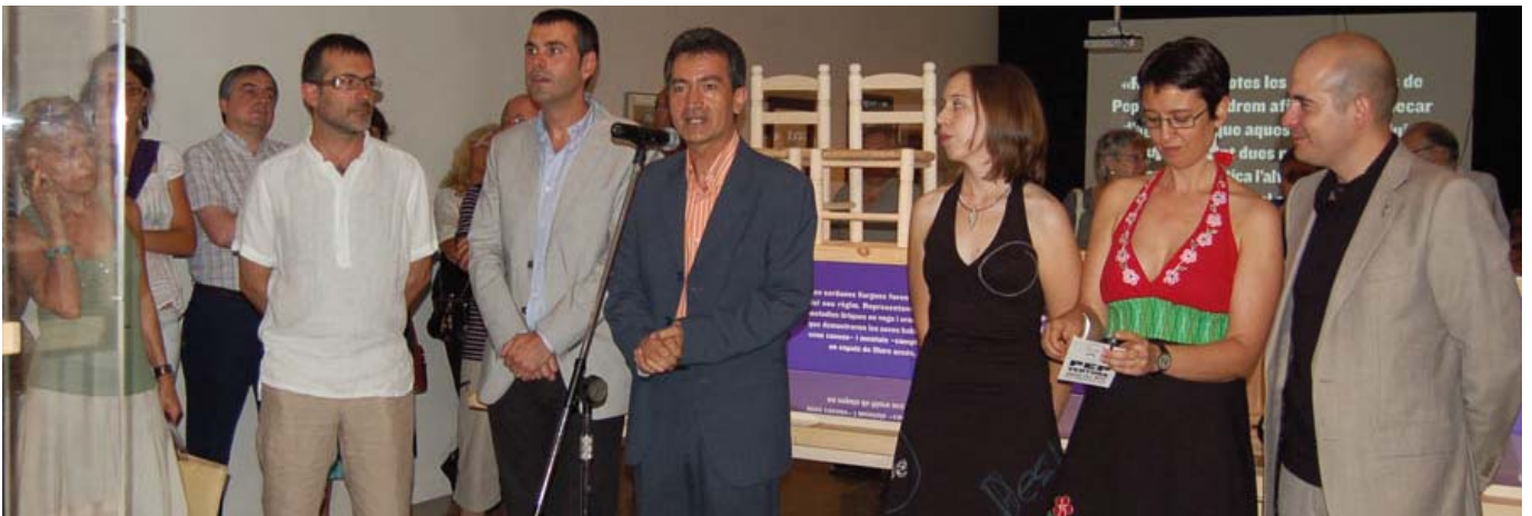
Inauguració de l'exposició "Pep Ventura abans del mite" el dia 1 d'agost.

Entre els objectes més destacats de l'Exposició, que està estructurada en quatre apartats, hi ha un disc de pedra enregistrat el 1908 per la cobla Antiga Pep de Figueres. El disc està considerat un dels primers enregistraments de músics catalans. Inclou Per tu ploro , estrenada poc abans de la mort del compositor, en la qual Ventura plorava per l'absència de Maria, la seva muller, morta el febrer de 1864.