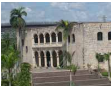
Alcàsser de Colom

El Bureau Internacional de Capitals Culturals i l'organització Capital de la Cultura Catalana han desenvolupat anteriorment campanyes d'elecció dels 7 tresors del Patrimoni Cultural Material a les següents ciutats o àrees del món: Catalunya 2007, Barcelona 2008, Brasília (Brasil) 2008, Madrid (Espanya) 2008, Nizhny Novgorod (Rússia) 2008, Sarajevo (Bòsnia i Hercegovina) 2008, Asunción (Paraguai) 2009, Badalona 2009 i Santo Domingo (República Dominicana) 2010.