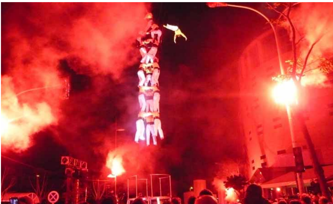
Speculum va acabar amb un castell humà suspès a l'aire.

El president de l'organització Capital de la Cultura Catalana, Xavier Tudela, va declarar al final de l'espectacle que "totes les capitals de la cultura catalana tenen alguna activitat singular que és recordada durant molt de temps. Sens dubte "Speculum" serà l'activitat emblemàtica de la Capital de la Cultura Catalana Badalona 2010, tot i que el que s'ha fet des de l'inici de la capitalitat i el molt que encara resta per desenvolupar té un gran potencial. Badalona ve de lluny, més de 2.000 anys d'història, i té un llarg camí per recórrer".