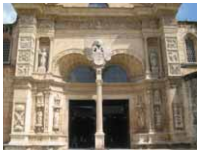
Catedral de Santo Domingo