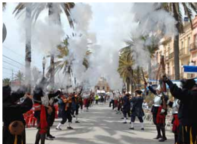
Concentració de trabucaires a la Rambla de Badalona.