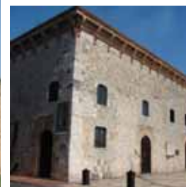
Museu de les Cases Reials