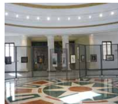
Palau de Belles Arts