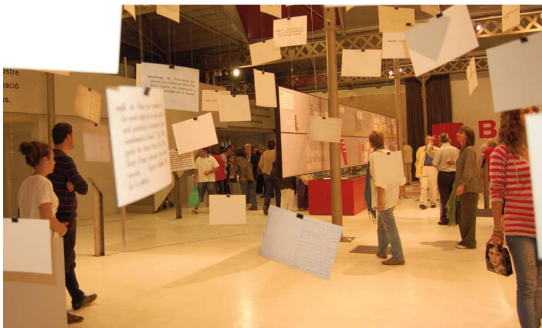
Vista general de l'exposició "Pompeu Fabra. Una llengua per a tot i per a tothom".

Fabra va escriure la part més important de la seva obra, com ara la Gramàtica Catalana, les normes ortogràfiques o el Diccionari general de la llengua catalana durant els anys que va viure a Badalona, ciutat que el va nomenar fill adoptiu. L'obra de Pompeu Fabra és fonamental ja que assentà les bases de la nostra llengua tal i com la utilitzem avui en dia, va unificar-ne l'ortografia i en fixà la gramàtica.